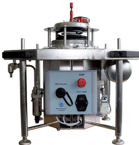
一体式 MESSKO® MPreC® 可移动压力释放阀测试台