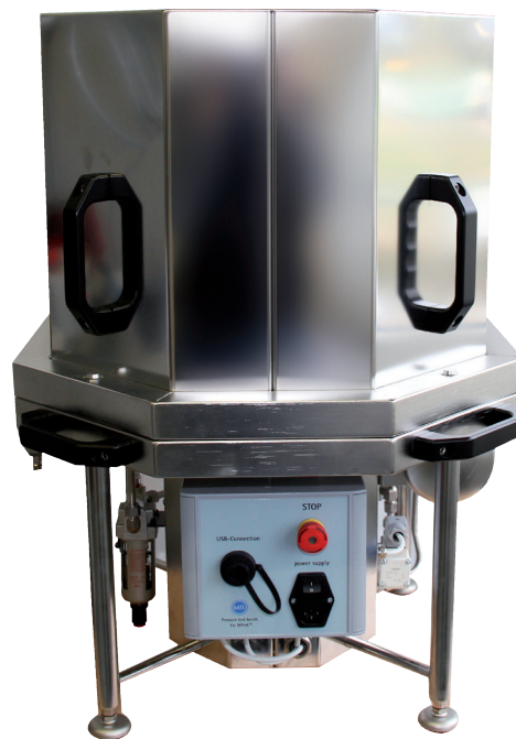
钟罩式 MESSKO® MPreC® 可移动压力释放阀测试台