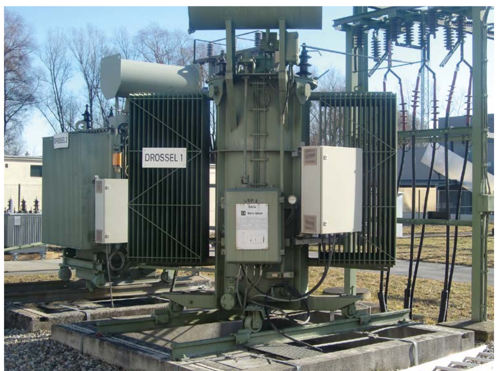
Tauchkern- bzw. Erdschlusslöschspule mit Motorantrieb Typ AEG vor dem Austausch.

Natürlich tauschen wir auch Motorantriebe für Anbauschalter, speziell in Nordamerika. Hierfür bieten wir den bewährten Typ MD II und die erweiterte Variante MD III.